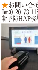
★お問い合わせ Tel.0120-73-1182 新予防HAPセンター

医療法人成和会 北大阪ほうせんか病院は、新型コロナウイルス感染症拡大を受け、「発熱外来」を設置、運営しています。インフルエンザの流行時期に新型コロナウイルスの感染蔓延が重なる状況下において、発熱のみでの受診が難しい状況となる中、少しでも地域の皆様が安心していただけるよう、また、今季は新型コロナウイルスの懸念もあり、事前に行き来と不安を少しでも無くせればと年末年始も一部休診