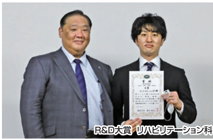
R&D大賞 リハビリテーション科