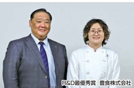
R&D最優秀賞 豊食株式会社

その後、「課題・目標設定力」「アイデア力」「表現力」「実現力」「感動力」の評価基準を設け、総合的な視点で厳正なる審査が行われ、次の4チームが各賞を受賞されました。