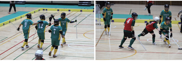
第13回ユニバーサルフロアホッケー西日本大会〜エフビコ杯〜

9月7日(土)、広島県福山市にあるエフビコアリーナふくやまにて開催されました。「第13回ユニバーサルフロアホッケー西日本大会」に出場いたしました。HCCチャレンジドジョブクラブの皆様とアシスタントドリビングホーム豊泉家 桃山台、豊泉家 チャレンジドセンター 住之江のフェローも一緒に参加し、総勢16名と昨年より多くのメンバーで「豊泉家」チームとなり大会に挑みました！今年度は昨年より参加チームが増加しており、例年よりも一試合多い状況で、体力的にもかなり厳しい戦いが繰り広げられましたが、皆必死にバックを追いかけて、ゴールを狙っていました。何より、チームメンバーの一人ひとりがチームワークを大いに発揮し、褒めあい、お互いを鼓舞しながら一杯プレーをしていました。そして結果は、デイビジョンCクラスで優勝を果たす事が出来ました！