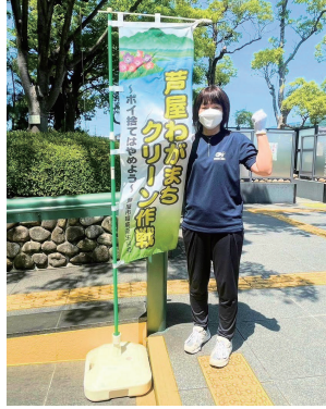
芦屋わがまちクリーン作戦にCCRC豊泉家 芦屋山手で動くフェローが参加した様子。