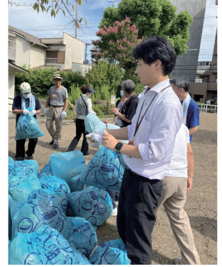
豊中市の自治会による公園清掃に豊泉家ランドマークタワーで動くフェローが参加した様子。